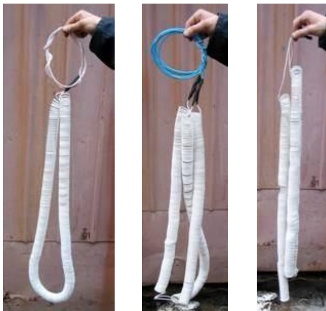
Рисунок 3. Подготовленные к монтажу ТЭНов. Слева направо: нитка, тройка и тройка без «холодных концов».

В целях ускорения монтажа ТЭНов в конструкции, а также для упрощения монтажных схем и экономии провода силовых линий при заготовке ТЭНов может проводиться их предмонтажная подготовка. Подготовка заключается в придании отрезкам ПНСВ формы спирали Ø30–40 мм (смотри Рисунок 3).