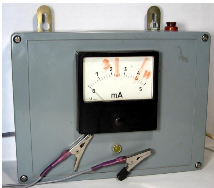
Рисунок 2. Омметр 0-5 Ом с линейной шкалой.

Для определения сопротивления отрезков провода необходим омметр, способный с точностью \pm 10\% измерять сопротивление в диапазоне 0 – 5 Ом. Так как отсчет показаний ведется обычно недостаточно квалифицированным персоналом, желательно, чтобы омметр имел линейную шкалу прямого отсчета. Один из вариантов подобного омметра демонстрирует Рисунок 2. На шкале видны отметки фломастером, соответствующие сопротивлению тройки – «3» и нитки – «Н».